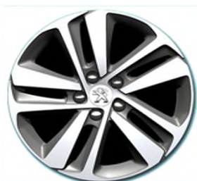
Jantes Alliage 17" diamantées