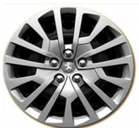
Enjoliveurs Full Cover 17"